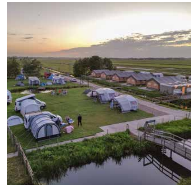
Camping bij Boerderij De Boerinn, sinds 2020, is een succes

„We hebben naast de camping meer nieuwe activiteiten ontwikkeld. Zo is er nu e-chopperverhuur, een blote voetenpad, sup-boards, geschenkpakketten en een klapkar waarmee mobiel kan worden vergaderd. Ook is de menukaart vernieuwd en een chef-kok aan het team toegevoegd. In de keuken gebruiken we voornamelijk lokale producten.” Dit sluit weer aan bij de plannen voor de toekomst. „Een tuinderij, voedselbos en eigen thee- en kruidentuin zijn in ontwikkeling. Dat past bij onze visie om in harmonie te werken met onze omgeving. Duurzaamheid staat hoog in het vaandel. Onze ambitie is om binnen vijf jaar zelfvoorzienend te zijn. We gaan investeren in zonnepanelen, een windmolen, verder isoleren en experimenteren met warmte uit compost, biomeiler.”